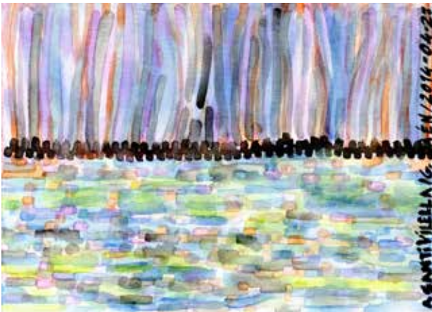
FOR SANTIAGO VILELLA