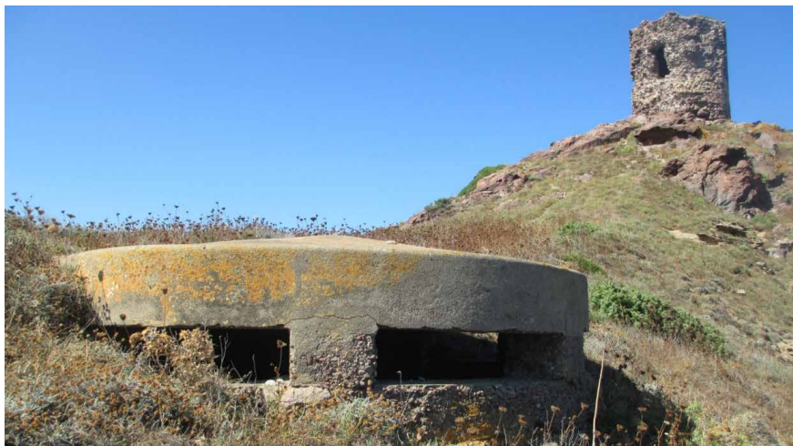
Pill-box near a 16th century tower along the coast of Tresnuraghes (Sardinia, Italy).

pagina a fronte Bunkers nel territorio di Quartu Sant'Elena (Cagliari, Italia). Prime letture per il rilievo delle architetture e del paesaggio (Pirinu 2017).